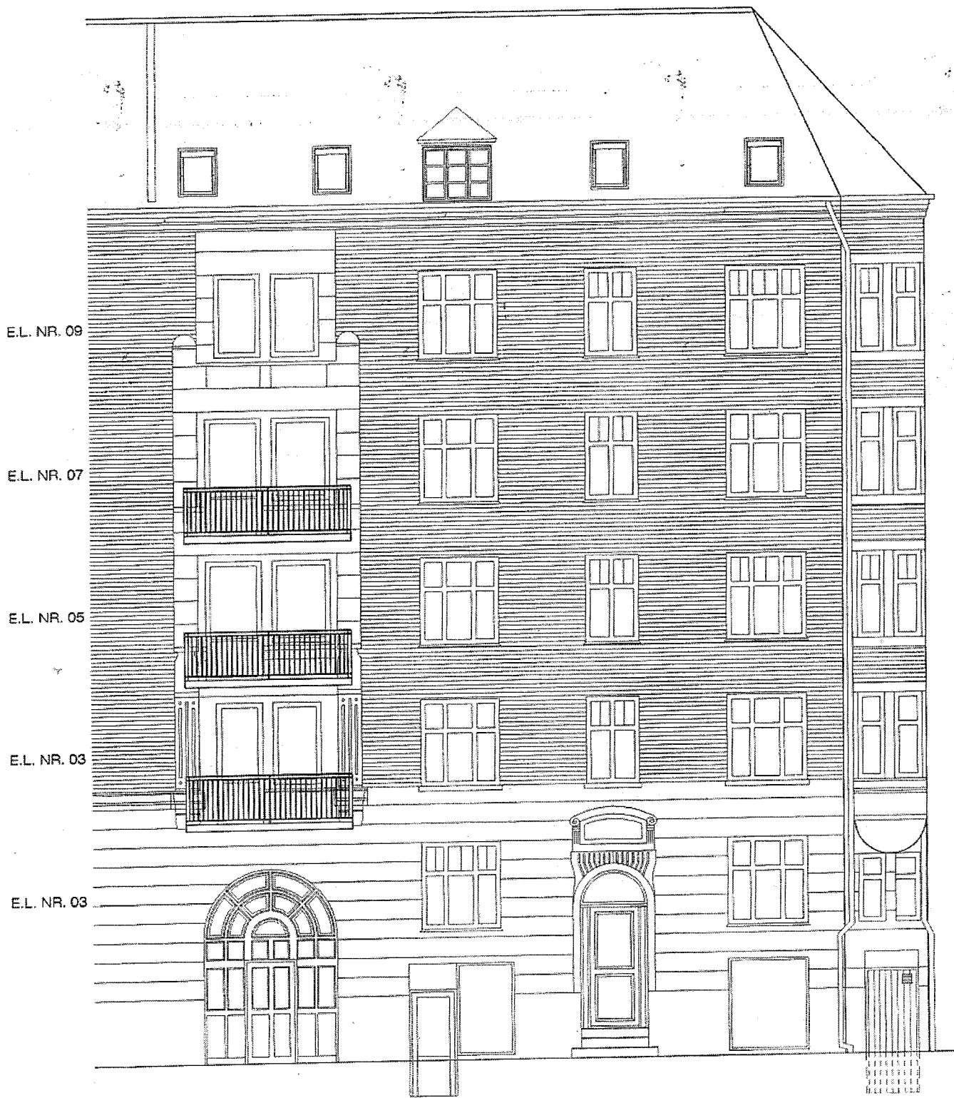
HOVEDDØR KRUSÅGADE 35